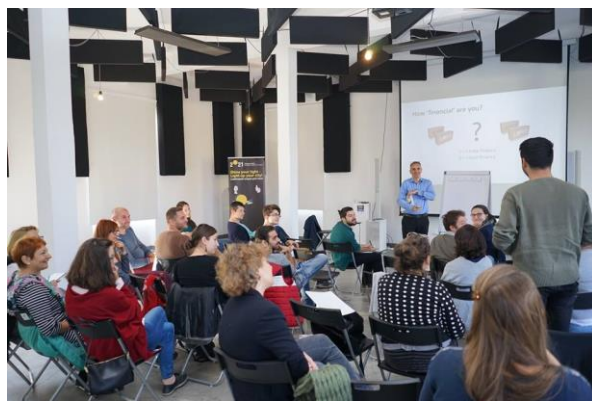
TMWork #1 MONEY și TMWork #2 PUBLIC, Arhiva ATCCE 2021