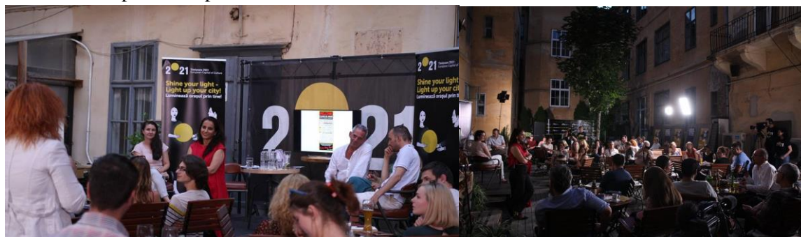
Café 21 din data de 20 iunie 2017