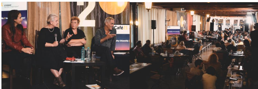
Café 21 din data de 5 septembrie 2017