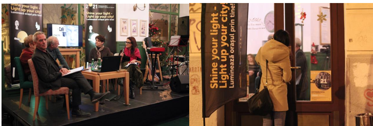
Café 21 din data de 19 decembrie 2017