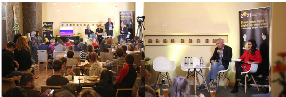
Café 21 din data de 3 octombrie 2017