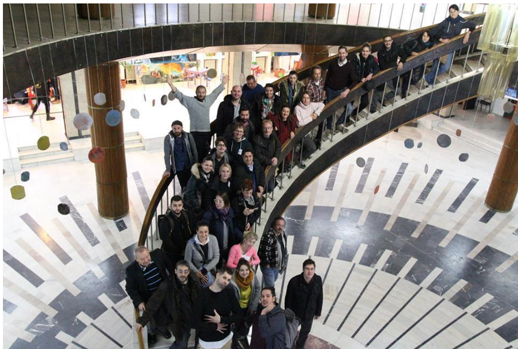
Lab for European Project Making, 9-16 decembrie 2017

În urma apelului deschis, organizat de TM2021 în perioada iulie-septembrie 2017, au fost selectați pentru a participa la acest program, nouă participanți din Timișoara, cărora li s-au alăturat opt participanți din Novi Sad, opt participanți din Rijeka și câte un participant din Debrecen (Ungaria) și Chemnitz (Germania).