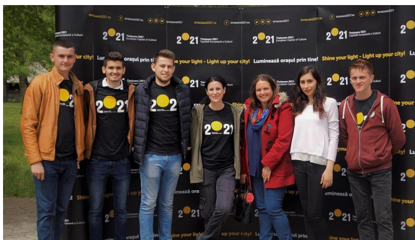
Participare cu stand la Ziua Europei – 6 mai Muzeul Satului Bănățean Timișoara

ATCCE a participat la evenimentul Ziua Europei în data de 6 mai 2017 alături de Prefectura Județului Timiș, Consiliul Județean Timiș, Primăria Municipiului Timișoara, Garnizoana Timișoara, Centrul de Informare Europe Direct Timișoara, Inspectoratul Școlar al Județului Timiș, Direcția Județeană pentru Sport și Tineret Timiș la Muzeul Satului Bănățean – prezența cu stand propriu, personalizat și organizarea colțului pentru ședințe foto.