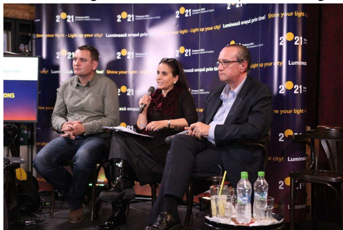
Café 21 din data de 6 noiembrie 2017