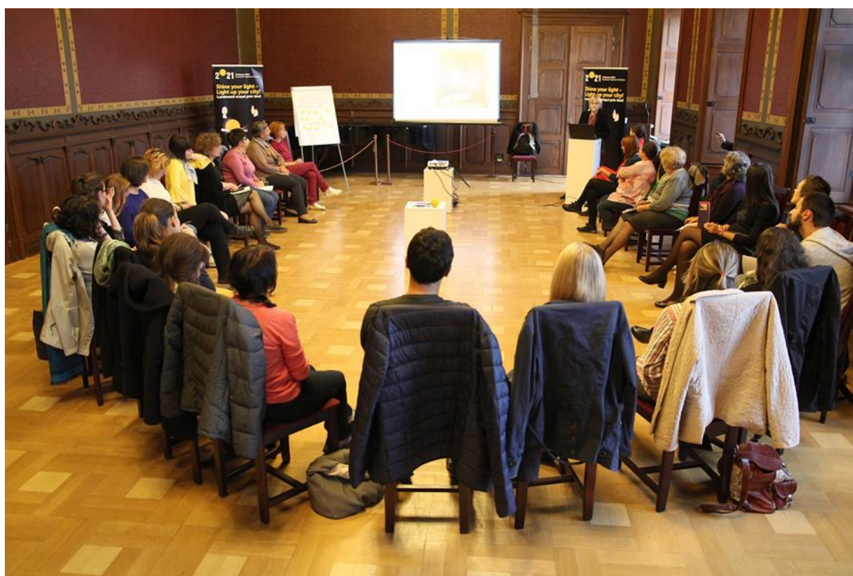
Atelier 22-24 septembrie 2017 Muzeul de Artă Timișoara