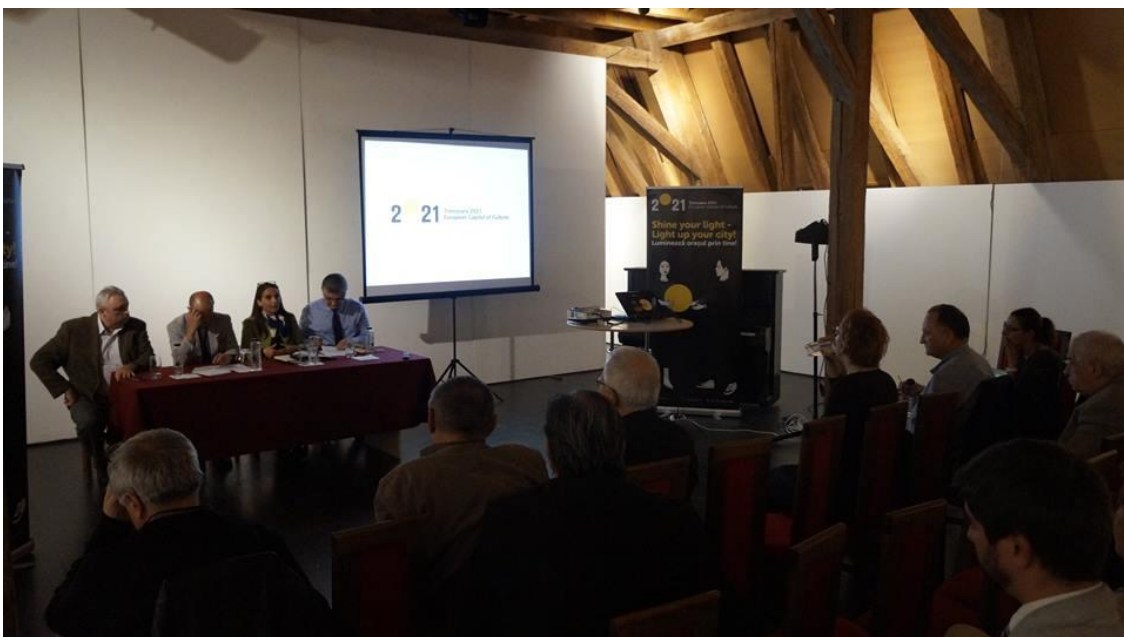
Adunarea Generală din data de 3 aprilie 2017

În urma ședinței Consiliului Director din data de 24 martie 2017 a fost convocată ședința Adunării Generale pentru data de 3 aprilie 2017.