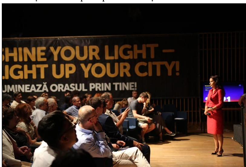
Lansarea publică a Programului Cultural, 19 iunie 2017

Asociația Timișoara - Capitală Culturală Europeană a prezentat în data de 19 iunie 2017, la ora 18:00, la Sala multifuncțională a Consiliului Județean Timiș, Programul cultural al etapei de StartUp (2017 - 2018), care face parte din strategia de implementare a proiectului TM2021. În etapa de StartUp, Asociația Timișoara Capitală Culturală Europeană consolidează astfel legăturile cu societatea civilă, dezvoltă latura culturală a orașului și a regiunii, sprijină colaborările cu instituțiile de cultură, deschide noi oportunități internaționale, ce vizează dimensiunea europeană a proiectului TM2021 și pune bazele dialogului cultural internațional. Evenimentele și activitățile organizate au fost construite și dezvoltate pe baza viziunii artistice a dosarului de candidatură și s-au axat pe implicarea cetățenilor în actul cultural.